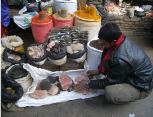
市場の岩塩屋さん。