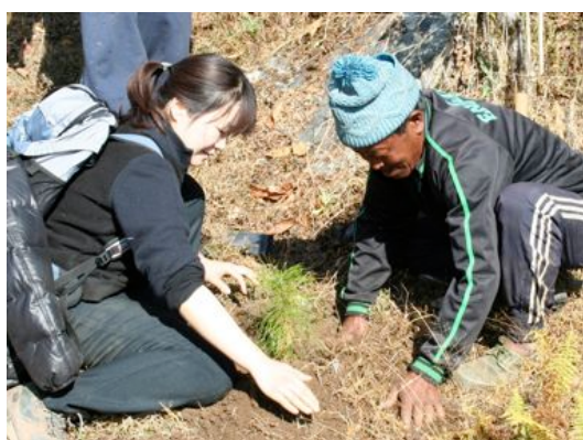
村人とともに植樹をする。

これまで 50 ヘクタールに 1 万～1.5 万本植樹してきた。苗畑センターがうまく機能するまでには、10 年要する。：3 年目から自立に向けて育成し、5 年目でセンターが落ち着くようなプログラムにしている。他の村にも苗を買ってもらい、森が広がるのが理想だ。