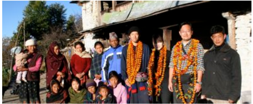
サリジャ村の人々とともに

2007年12月21日から2008年1月4日にかけて、第14回山岳エコロジースクールを開催しました。今回はパルバット郡サリジャ村を訪問し、この村でのスクールの開催は今回がはじめてでした。