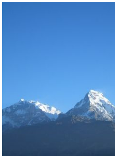
ナンギからアンナプルナをのぞむ。