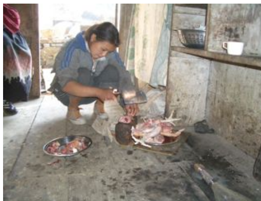
チキンカレーを注文したら鶏をさばいてくれた。