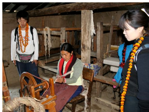
糸紡ぎを見学する。