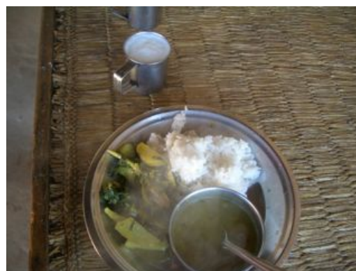
ステイ先の食事（ダルバート）

2 本の植樹をする為に山をかなり登った。どこまで登るの…と何度も思わせるほど山に登った。岩・石だらけのため、穴を掘るのもやっと。何万本植えることはかなり困難を要