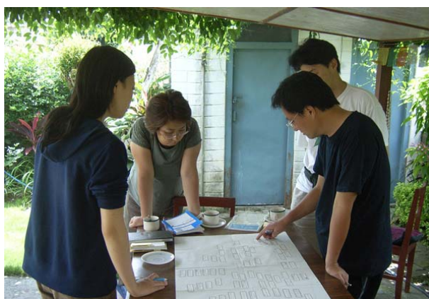
まとめのミーティング