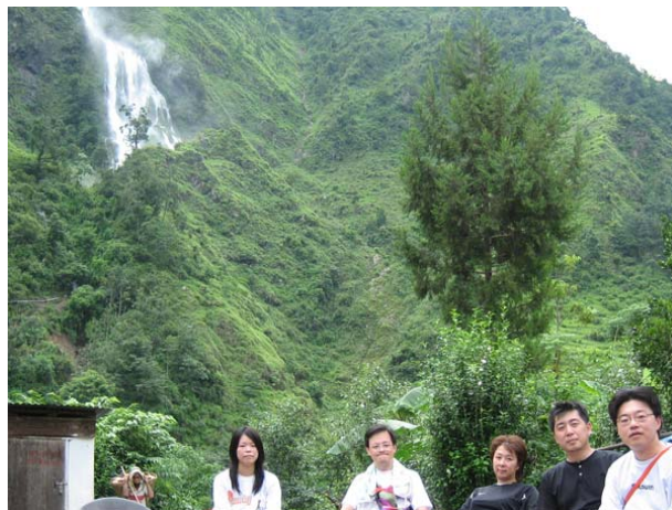
ナルチャン村に到着