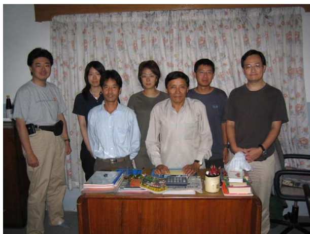
ヒマラヤ保全協会ネパール事務所にて