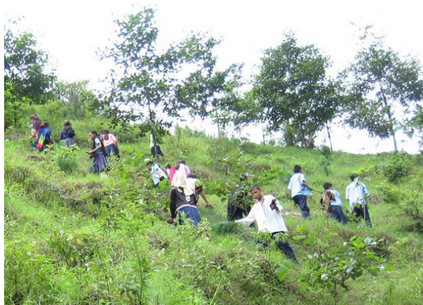
村人とともに植樹