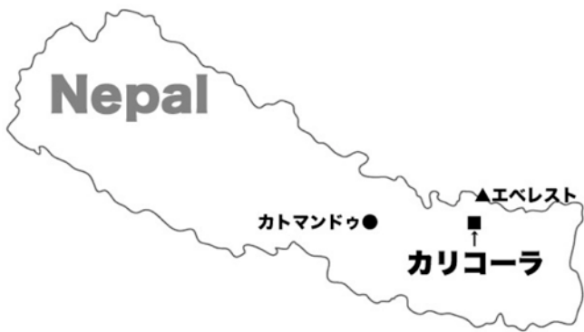
新植林地・カリコーラ村の位置