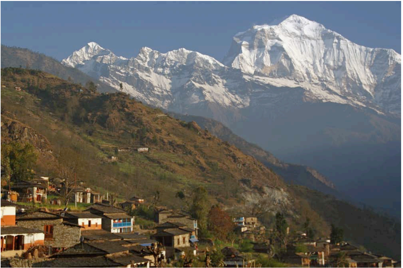
ダウラギリ（8167m）と新プロジェクト地・ジーン村