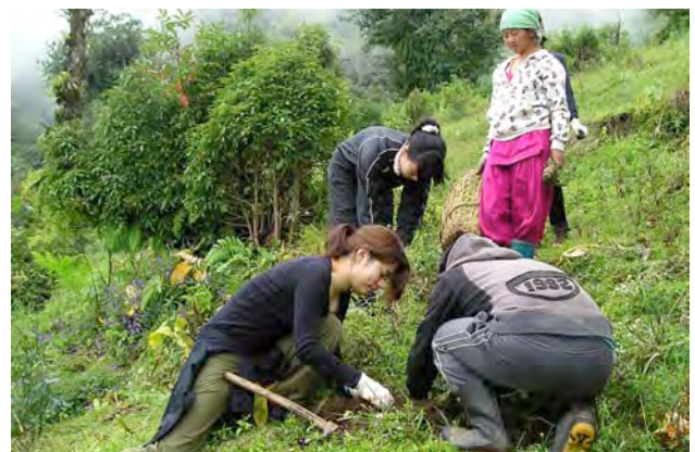
植林地に苗木を植える(サリジャ村)