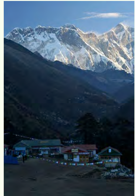
タンポチェからエベレスト(8848m)をのぞむ

いうまでもなくヒマラヤ山脈は世界最大の地形的高まりであり、それが、対流圏(高さ 12km まで達する)につきだした巨大な障害物となり、ジェット気流や偏西風のような大気の流れに大きな影響をおよぼしています。その結果、ヒマラヤを境にして、乾燥した西南アジアと湿潤な東南アジア(モンスーン・アジア)が出現し、ヒマラヤ南麓は降水が多く多雨地帯となっています。