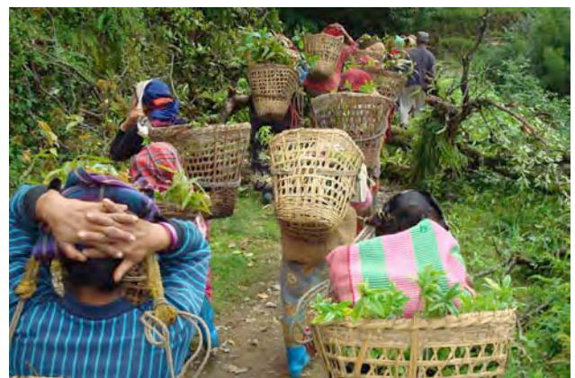
村人が総出で植林地に苗木をはこぶ(サリジャ村)

また、この活動により、自然災害を軽減し人々の命を救うための防災林育成、山岳斜面の保全に関する基