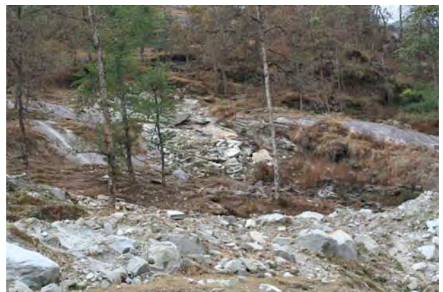
荒廃がすすむヒマラヤの山岳斜面（ベガコーラ村）