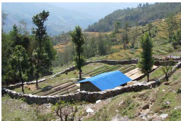
拡充をすすめる苗畑（ジーン村）

昨年度にひきつづき、ベガ村において、金属製改良かまどの普及をおこないます。本年度は 25 世帯に設置します。これにより、かまどの熱効率が上がり、薪の使用量を各世帯で 40～50%減らすことができます。したがって、森林保全に貢献するとともに、薪運搬量をへらせるので労働の軽減にもなります。また、煙突も設置するので煙が室内に充満することがなくなり健康にもよいです。調理時間も短縮できます。