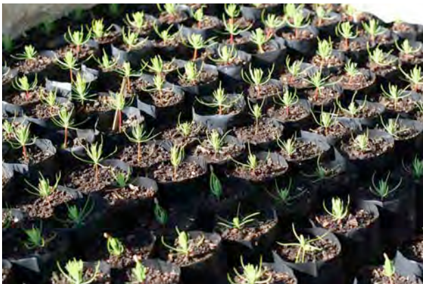
苗畑でそだつ苗木（マツ/ドバ村）

ネパールでは、住民のライフスタイルの変化、観光客の流入などにより、様々なゴミが多量に廃棄されるようになっていきます。